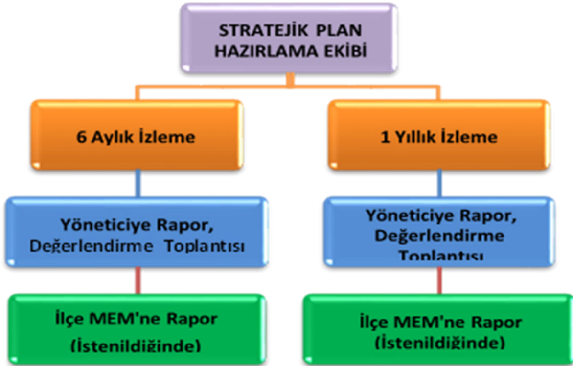
Şekil 3: İzleme ve Değerlendirme Süreci

Müdürlüğümüzün 2019-2023 Stratejik Planı İzleme ve Değerlendirme sürecini ifade eden İzleme ve Değerlendirme Modeli hazırlanmıştır. Müdürlüğümüzün Stratejik Plan İzleme- Değerlendirme çalışmaları eğitim-öğretim yılı çalışma takvimi de dikkate alınarak 6 aylık ve 1 yıllık sürelerde gerçekleştirilecektir. 6 aylık sürelerde rapor hazırlanacak ve değerlendirme toplantısı düzenlenecektir. İzleme-değerlendirme raporu, istenildiğinde İlçe Millî Eğitim Müdürlüğü'ne gönderilecektir. Ayrıca ilçemizin Mülki İdari Amirine sunulacaktır. 1 yıllık izleme-değerlendirme çalışmaları, Stratejik Planımızda yer alan hedeflerin yıllık düzeyde ifade edildiği Performans Programı ve yılsonunda gerçekleşme düzeylerinin belirlendiği Faaliyet Raporu hazırlanarak yapılacaktır.